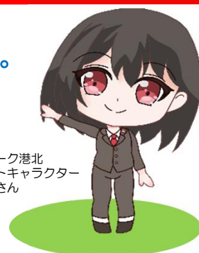
ハローワーク港北 マスコットキャラクター はろうめさん