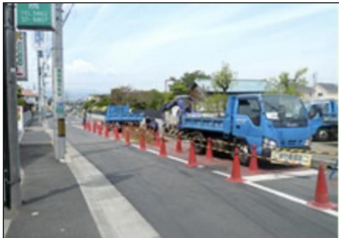
①ガス工事着工前 これからガス工事を着工します。