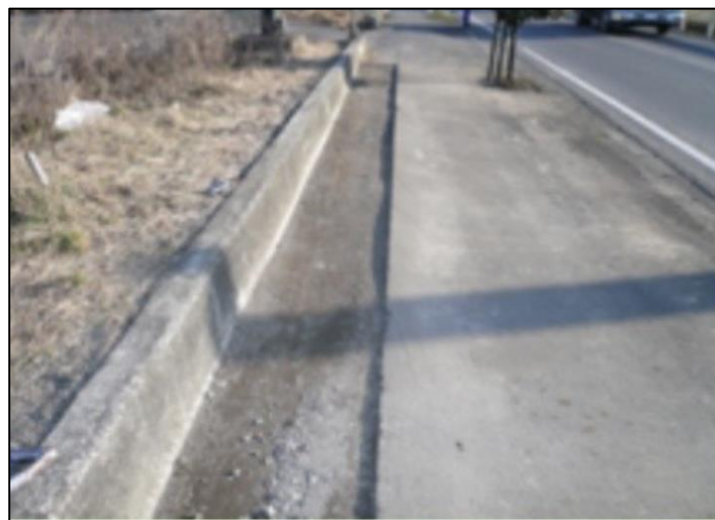
⑦ガスマン設箇所、埋め戻しをした状態です。