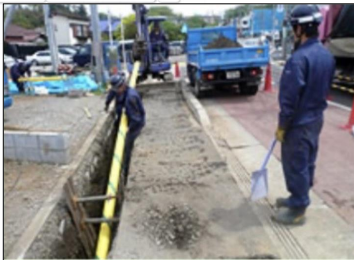
⑤ガス管を布設します。