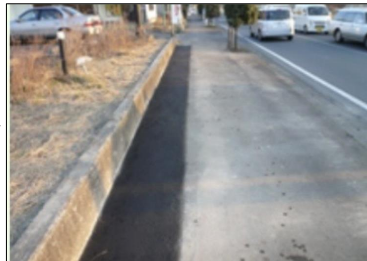
⑧最後にアスファルト合成で仕上げし、作業終了です。