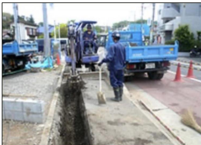
③ガス管理設のため、掘削していきます。