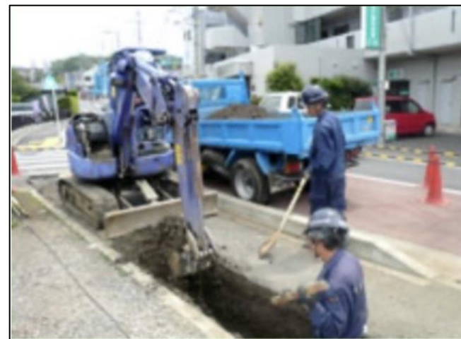
④掘削による残土処理を行います。