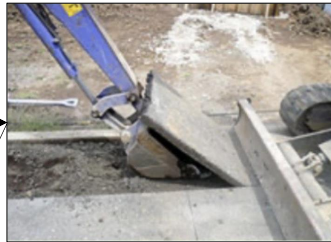
②ガス工事施工による掘削箇所の舗装めくりを行います。