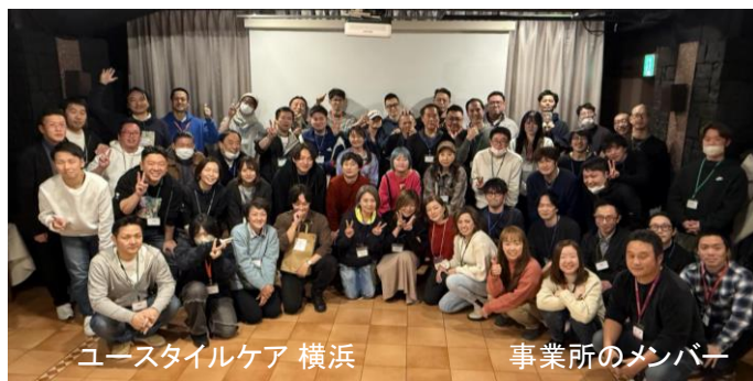
ユースタイルケア 横浜