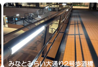
みなとみらい大通り2号歩道橋