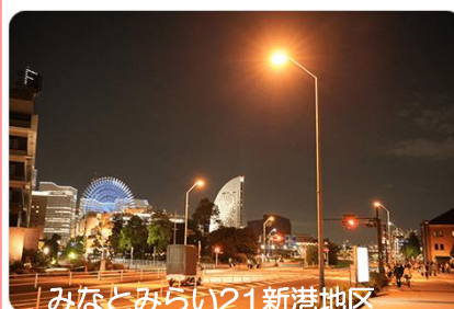
みなとみらい21新港地区