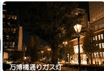
万博橋通りガス灯