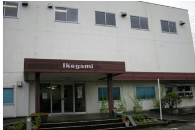
所在地：藤沢市小塚400

放送用カメラ、スタジオ設備から、医療用・セキュリティまで社会インフラを支える高度な技術を展開します。