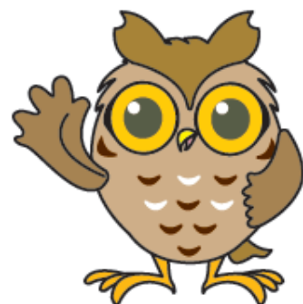
瀬谷区マスコットキャラクター せやまる