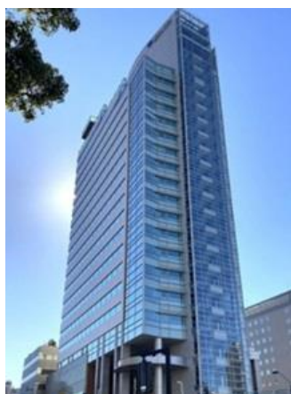
富士ソフト本社ビル (桜木町)