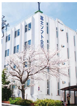
富士ソフト企画本社ビル (鎌倉市)