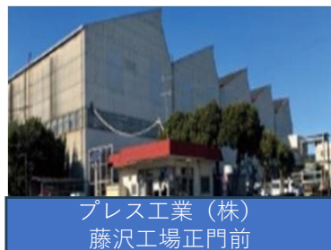
プレス工業（株） 藤沢工場正門前