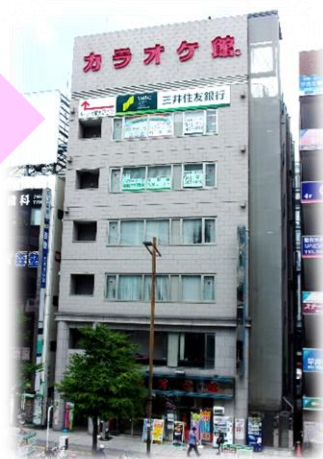
相模大野駅 北口 目の前 （カラオケ館のビル6F）