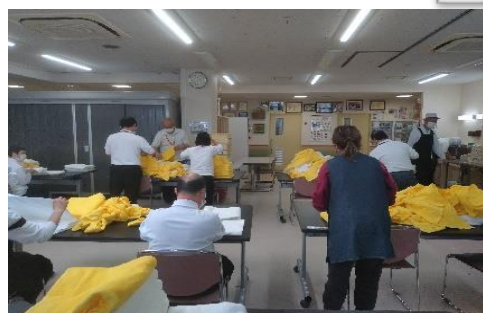
▶洗濯したタオルを丁寧に畳んでいます。