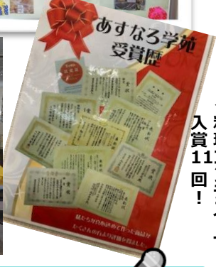
◀料理コンテストで入賞11回！