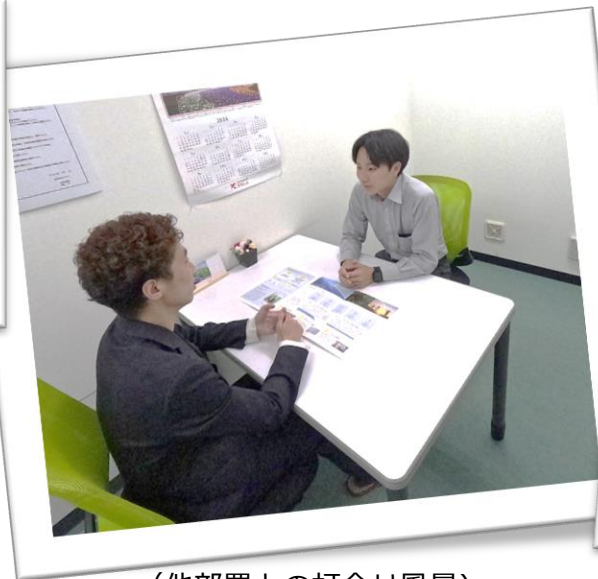
(他部署との打合せ風景)