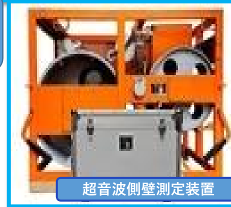
超音波側壁測定装置

当社は、大手ゼネコン等へ超音波側壁測定装置、分電盤、電線などの建設資材のレンタルをおこなっています。レンタルは不況にも強く業績も安定しており賞与は年3回、昇給も実施しています。業界・職種未経験でもしっかり研修・OJTを実施しますので安心してご応募してください。