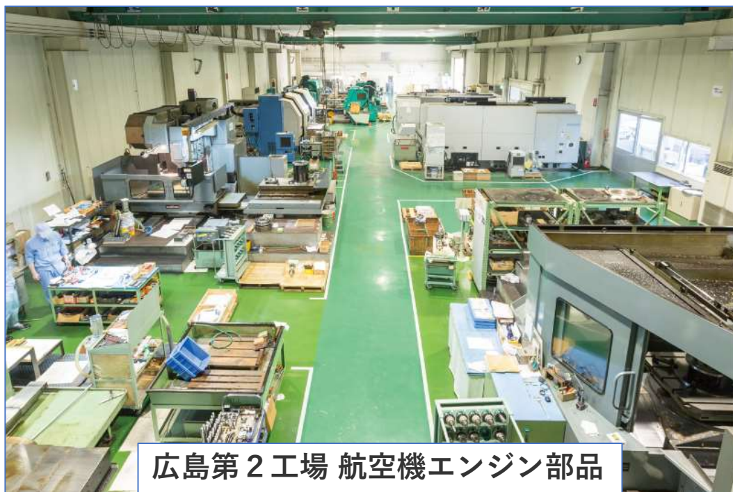
広島第2工場 航空機エンジン部品