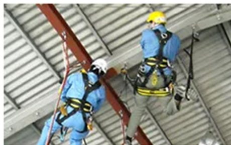
▶ トレーニングセンター