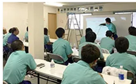
▶ 研修・安全衛生講習会