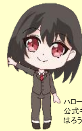
ハローワーク港北 公式キャラクター はるうめさん