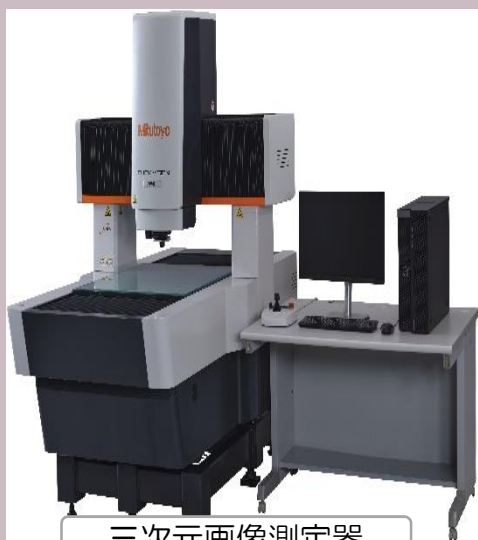
三次元画像測定器