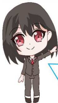
ハローワーク港北 公式キャラクターはろうめさん

看護補助者(看護助手)のしごとを知るセミナーです。 仕事内容、働き方の特徴、資格取得によるキャリアアップなど 看護補助者(看護助手)とはどんな仕事なのか、介護職との 違いなどをわかりやすく解説します!! この機会に是非、このセミナーにご参加下さい!!