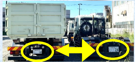
ナンバープレートが大きい方が大型車▲