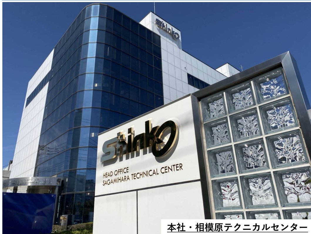
本社・相模原テクニカルセンター