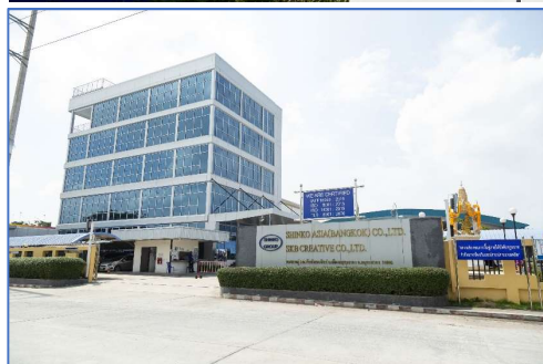
海外拠点 ←タイ工場 (従業員約1800名)