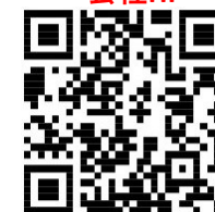
相模工場 (三菱電機 鎌倉製作所 相模工場内)