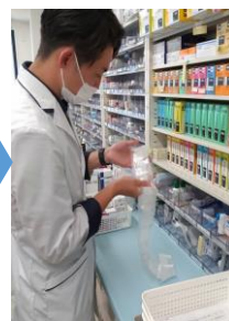
薬剤師による目視確認