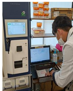
複数の薬を分包できる機械にデータを入力