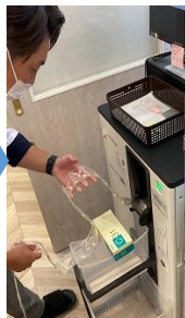
分包した薬を監査機に投入