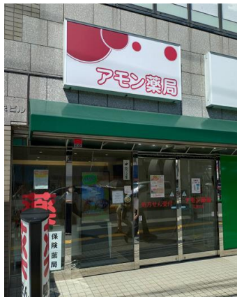
アモン薬局 (久里浜店)