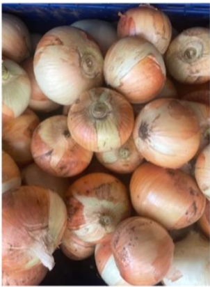
(三浦市内の小中学校給食に納品する玉ねぎ「ケルたま」)