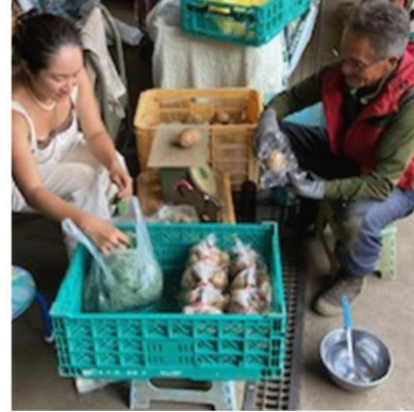
(ジャガイモを袋に詰めて出荷準備中)