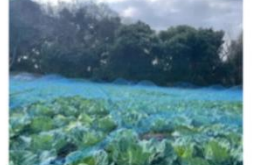
(収穫前のキャベツ畑)