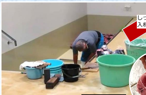
▲売主から鮪が届いたらしっぽをカット