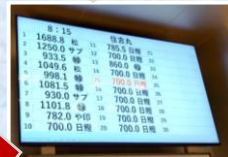
▲モニターに落札者が表示される