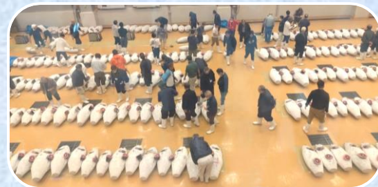
▼仲買人が入札額を考えているところ