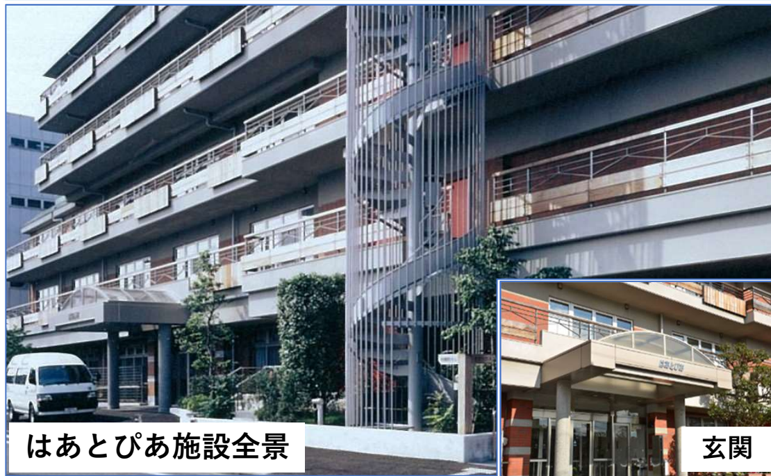
はあとぴあ施設全景