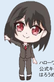
ハローワーク港北 公式キャラクター はろめさん