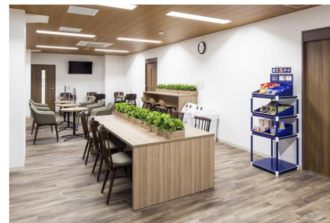
↑職員食堂の写真です