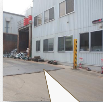
ココの鉄板が台貫(だいかん) 乗るとトラックの重さが量れます