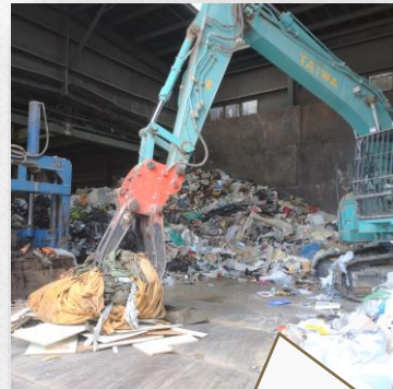
重機を使って一気に楽ちん！ 品目ごとに降ろしていきます