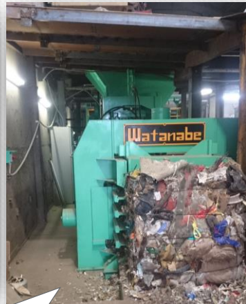
圧縮されたゴミは重量 なんと1000kg！