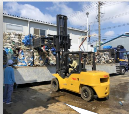
圧縮されたゴミを、フォークを使って トレーラーに積んでいきます