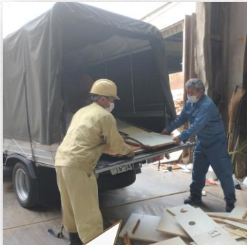
お客さんのお手伝い！