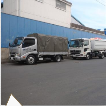
会社前に並んで待機中…