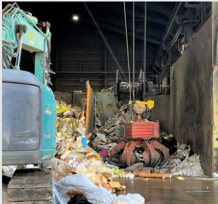
クレーンでゴミをつかんで、 圧縮機に入れていきます