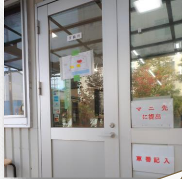
お客様が受付事務所に マニフェストを出しに来ます