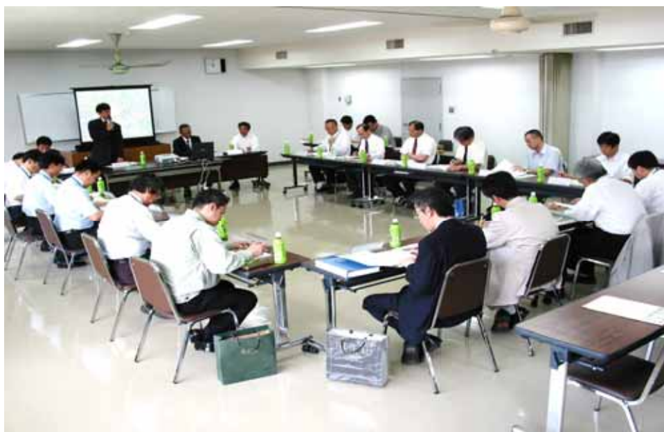
《昨年度の開催状況》