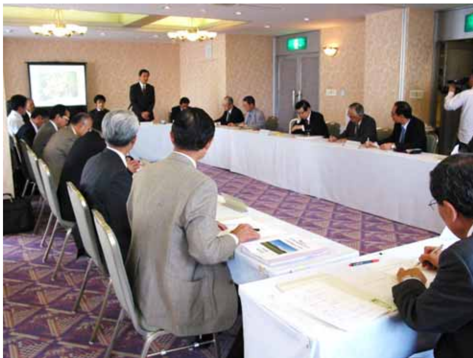
《挨拶する覺正労働局長》

各団体代表者等からは、昨年度の災害防止活動についての取り組み状況を踏まえたパトロールの実施やリスクアセスメントの普及の取り組み等、本年度の労働災害防止計画について発表等がありました。 （労働基準部安全衛生課）