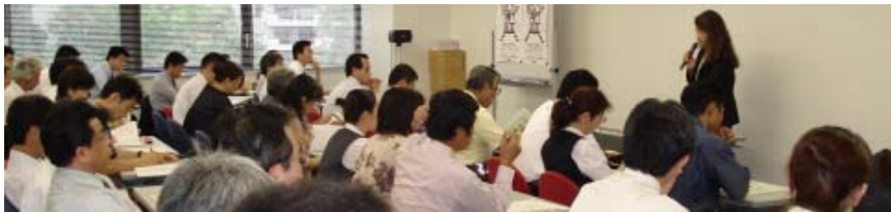
改正男女雇用機会均等法説明会