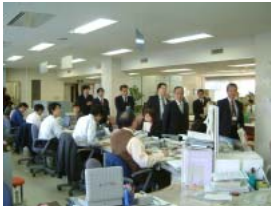
ハローワーク鹿児島の視察