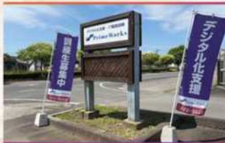
・駐車場入口(20台分完備)