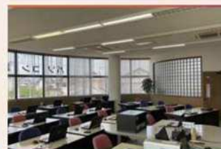
・教室風景3(個別のデスク)