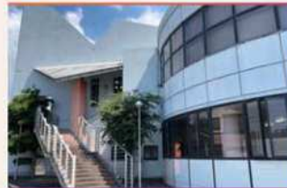
・入口階段(教室は2F)