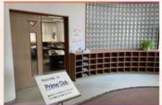
・エントランスホール