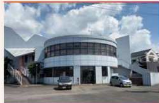
・プライムワークス建物全景