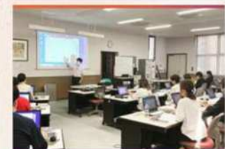
・訓練風景 (100inch大型スクリーン)

株式会社プライムワークス IT関連の職業訓練や、企業向 けのデジタル化支援業務を、 行っている会社です。