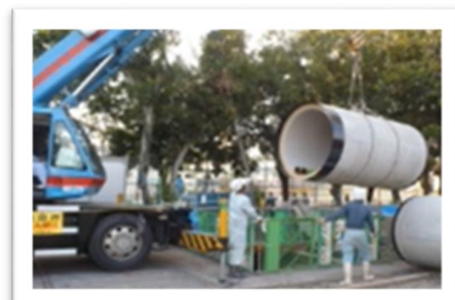
前回までの提供動画より抜粋