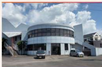
・プライムワークス建物全景