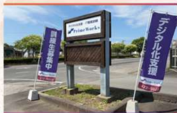
・駐車場入口 (20台分完備)