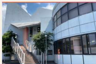
・入口階段 (教室は2F)