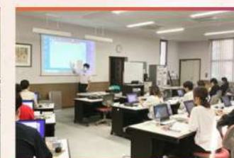
・訓練風景 (100inch大型スクリーン)