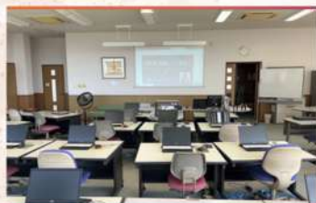
・教室風景 1 (全26席)