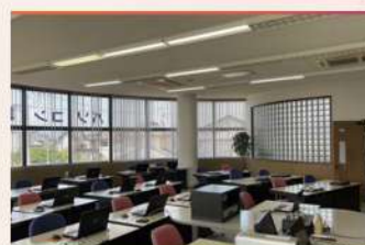
・教室風景 3 (個別のデスク)