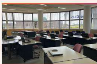
・教室風景 2 (面積-120m2)