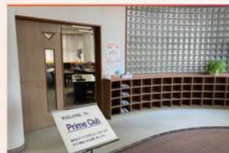
・エントランスホール