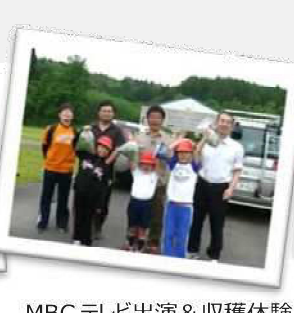
MBC テレビ出演 & 収穫体験