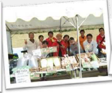
悠久の森ウォーキング大会出店