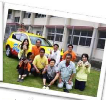
ポニー号 MBC ラジオ出演