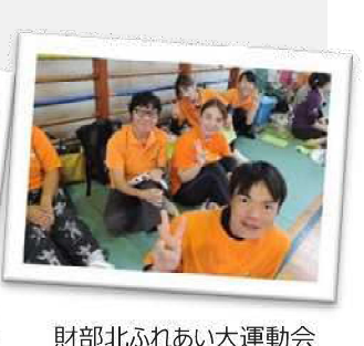
財部北ふれあい大運動会