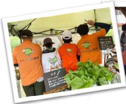
ど〜んと鹿児島出演