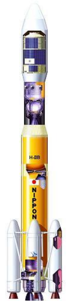
H-IIロケット

鹿児島公共職業安定所 熊毛出張所 鹿児島県西之表市西之表16314-6 種子島合同庁舎 1F TEL 0997-22-1318 FAX 0997-23-4852