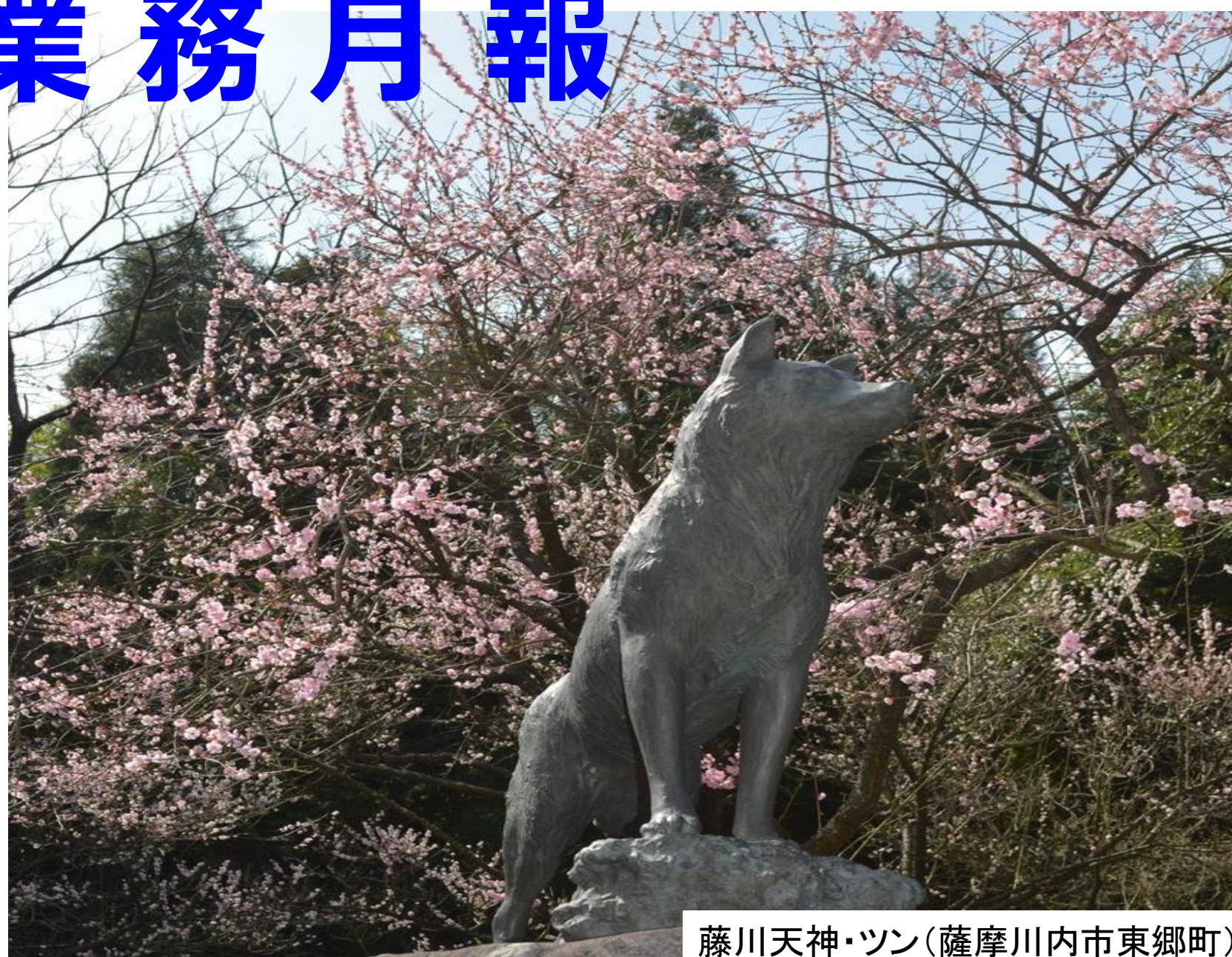
藤川天神・ツン(薩摩川内市東郷町)

川内公共職業安定所 薩摩川内市緑若葉町4-24 TEL 0996-22-8689