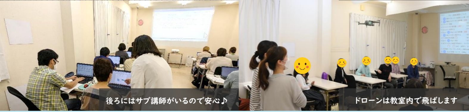
後ろにはサブ講師がいるので安心♪