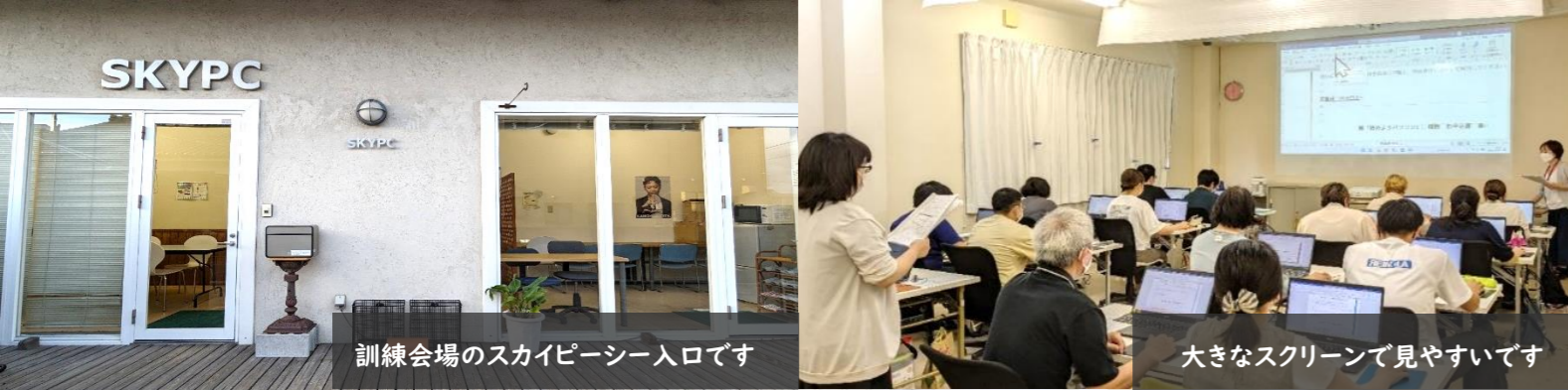
訓練会場のスカイピースー入口です