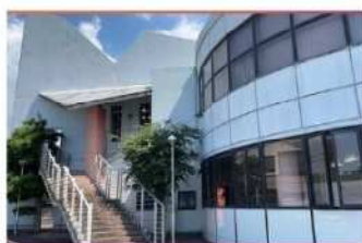
・入口階段 (教室は2F)