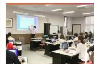
・訓練風景 (100inch大型スクリーン)