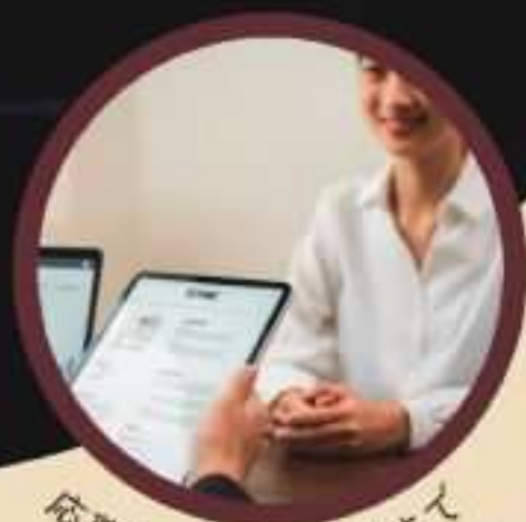
応募書類～面接対策まで