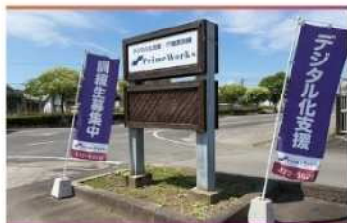
・駐車場入口 (20台分完備)