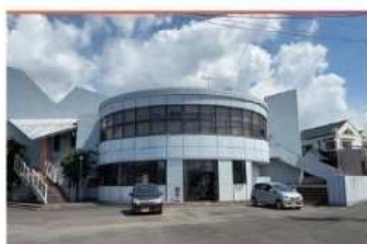
・プライムワークス建物全景