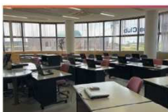
・教室風景 2 (面積-120m2)