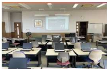
・教室風景 1 (全26席)