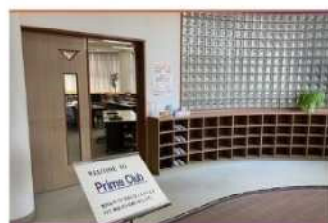
・エントランスホール