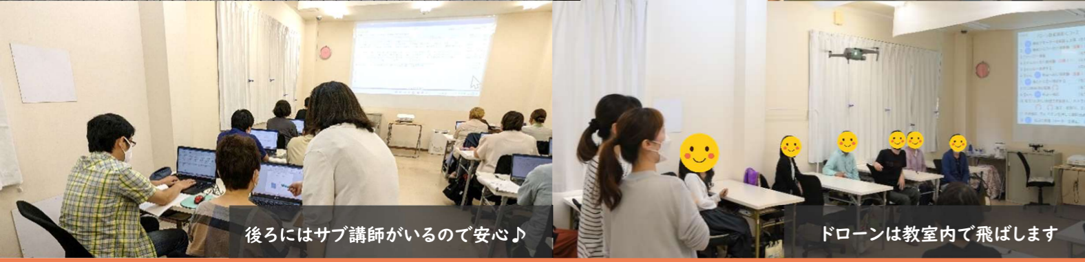
後ろにはサブ講師がいるので安心♪