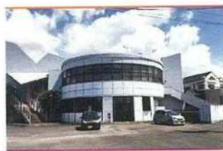
・プライムワークス建物全景