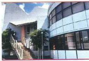
・入口階段 (教室は2F)