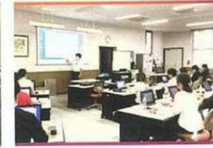
・訓練風景 (100inch大型スクリーン)