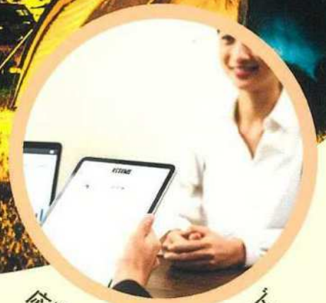
応募書類～面接対策まで