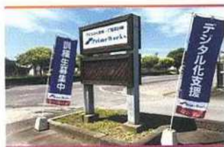
・駐車場入口 (20台分完備)