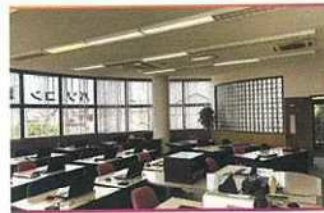
・教室風景 3 (個別のデスク)