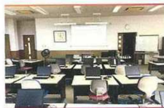
・教室風景 1 (全26席)