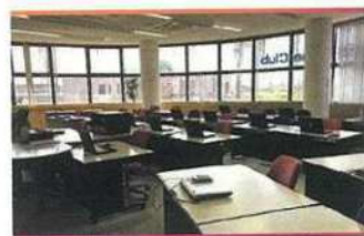
・教室風景 2 (面積-120m2)