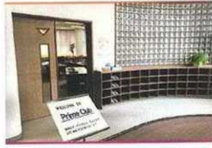
・エントランスホール