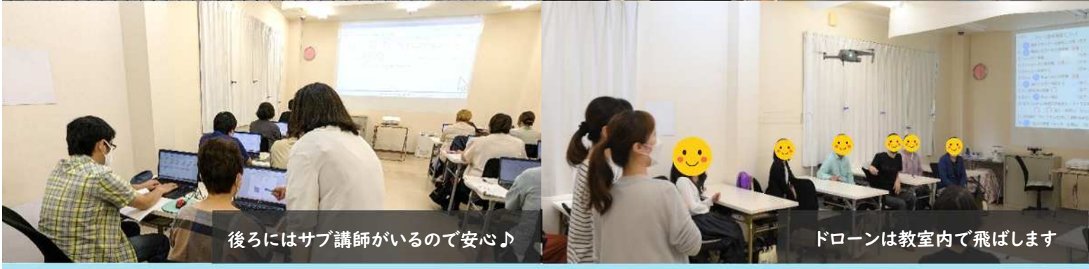
後ろにはサブ講師がいるので安心♪