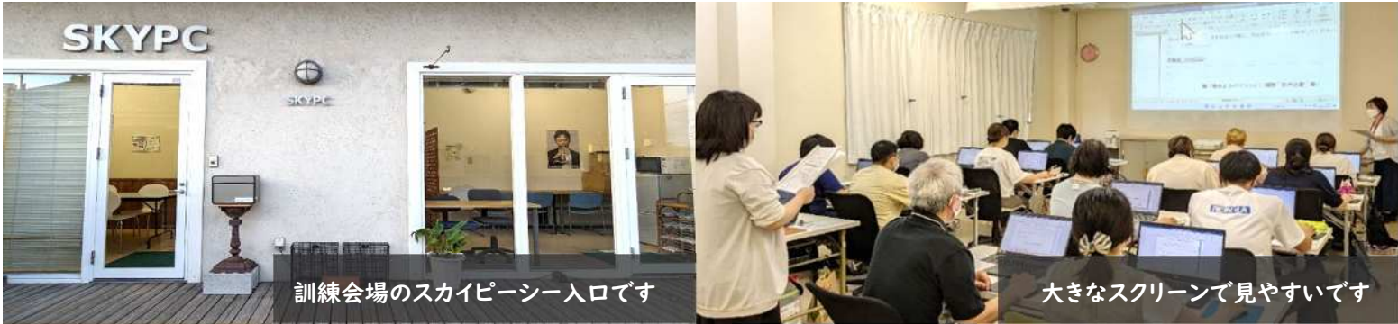
訓練会場のスカイピースー入口です