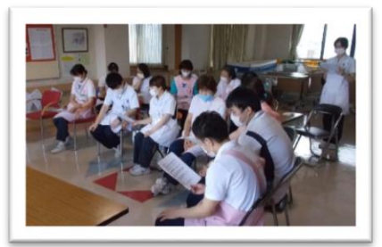
前回までの提供動画より抜粋