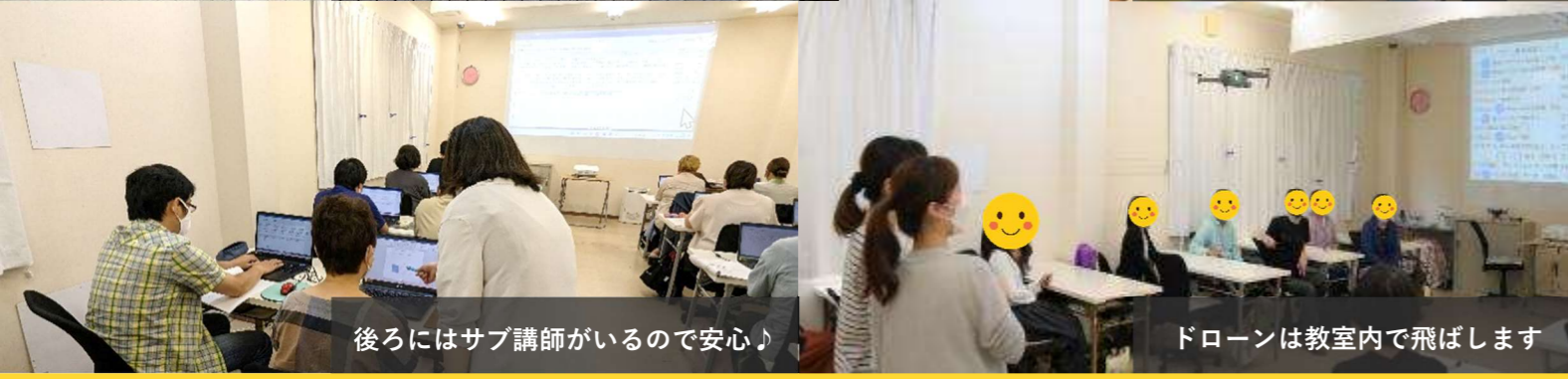
後ろにはサブ講師がいるので安心♪