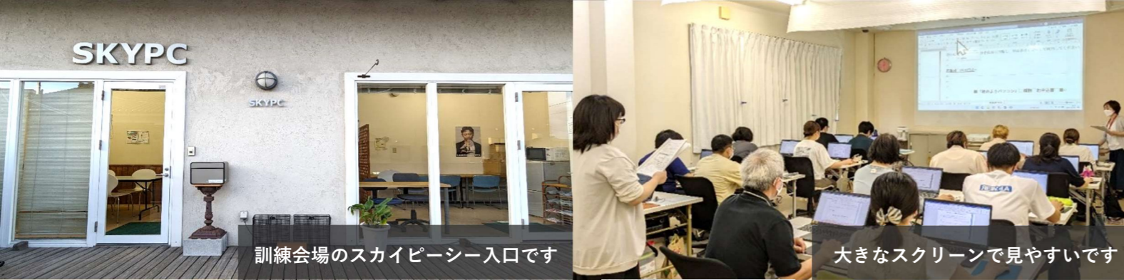
訓練会場のスカイピースー入口です