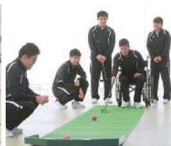
■ レクリエーション実習