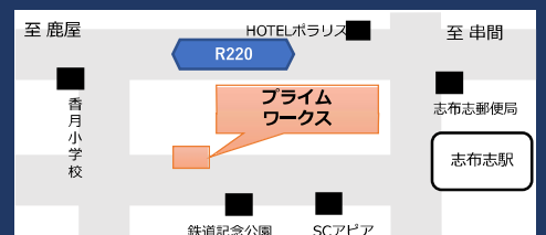
東九州自動車道: 志布志IC・志布志有明ICより5分