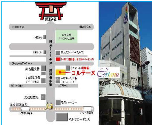
【選考試験会場地図】 〇帖佐駅から1.5km