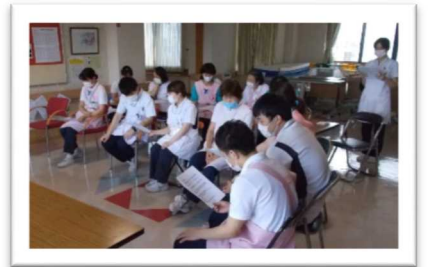
前回までの提供動画より抜粋