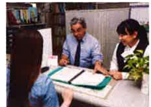
進学やキャリアアップのサポートなど柔軟な対応をします