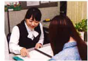
希望に添った職場をお探します