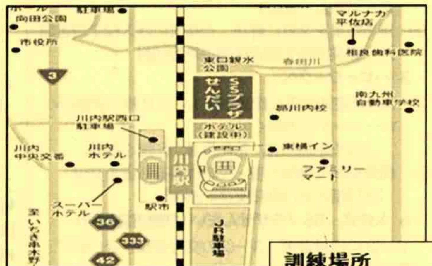
訓練場所 SSプラザ川内