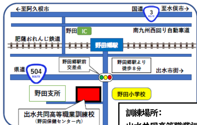
訓練場所: 出水共同高等職業訓練校 【駐車場有り】